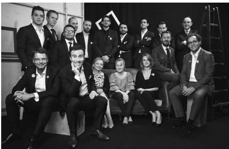
Soirée anniversaire des 10 ans d'Inocap Gestion