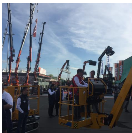
Visite d'une société française spécialisée dans les engins de travaux publics

INOCAP Gestion est impliquée dans le suivi et l'accompagnement des sociétés dans lesquelles elle investit dans leur développement. Pour cela, nous organisons des rencontres 1 to 1 une à deux fois par an avec l'ensemble des sociétés présentes dans nos portefeuilles. En visitant ces sociétés, nos gérants s'entretiennent avec les dirigeants afin de s'assurer de leur stratégie de développement.