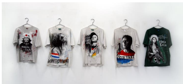
Sweating Losers, Julien Beneyton