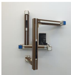
Osmosis #1, Jonas Wijtenburg