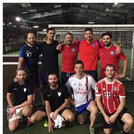
Tournoi de football en salle